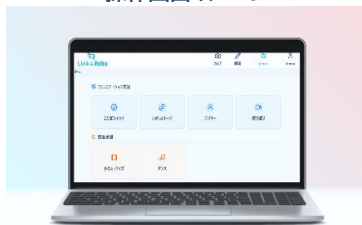
操作画面イメージ